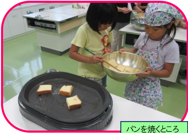
パンを焼くところ