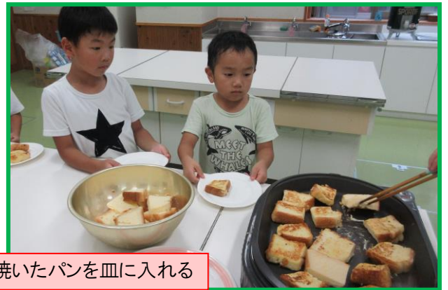
焼いたパンを皿に入れる