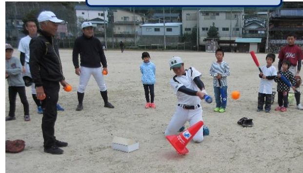
高野連の方から指導を受ける

10月27日(土)全児童を対象に『梶原高校野球部とキャッチボールをしよう!』と声をかけたところ、24名からやってみたい!と申し込みがありました。野球部員とランニング・体操・キャッチボール・守備練習をしました。今回は、“高知県高等学校野球連盟白球会”の方が3名も来られ、直接指導をしてくださいました。初心者や低学年には、ボールが当たりやすいバットを使用してバッティング練習を行い、それぞれの能力に合わせた練習をすることができました。子どもたちからは「面白かった!もっとしたい!」と声があがりました。