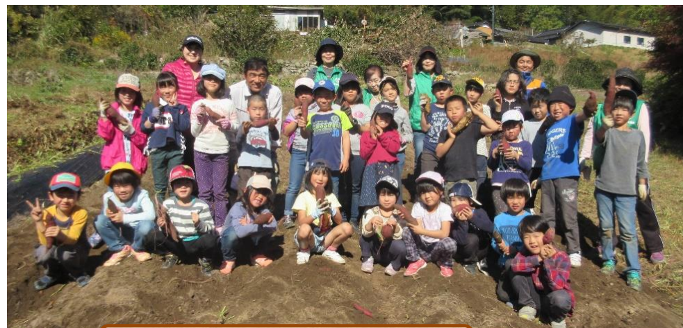
芋掘り：お気に入りの芋をもって