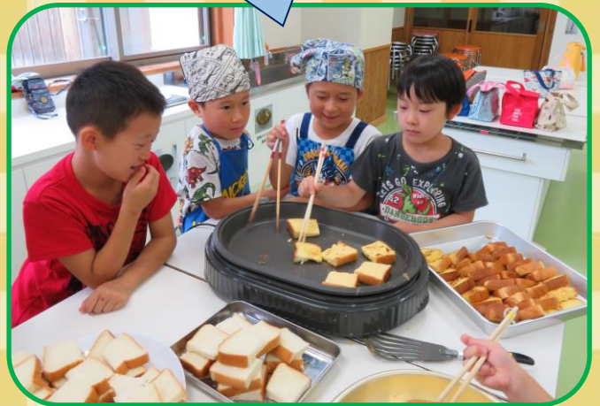
焼きすぎないようにしよう!